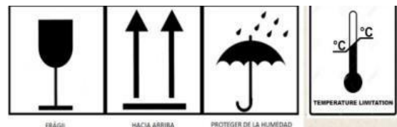
Fig. 3. Pictograma para el yonque

Además, que se le coloca los pictogramas necesarios para tener cuidado con el producto [31]. Siendo estas imágenes que comunican el correcto manejo, traslado y conservación del producto [55]. Según, en las exportaciones de vino irían los siguientes pictogramas: frágil, hacia arriba, proteger de la humedad y temperatura limitada adecuados para esta bebida alcohólica o similar a ella [54].