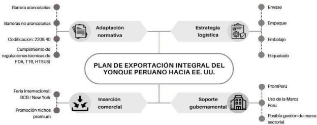
Fig. 7. Puntos clave de la propuesta

Siguiendo ese enfoque de difusión a través del gobierno, se debería usar la misma táctica de respaldo para el yonque usando la marca Perú considerada una herramienta fundamental para dar una imagen sólida del producto y promoción internacional que ayudará al yonque así como lo hizo con el Pisco peruano. Además, con la posibilidad de crear una marca sectorial como Pisco, Spirit of Peru que se creó en el 2019 por parte de PROMPERU permitiendo revolucionar la cadena productiva, comunicación versátil y promover el consumo los diversos mercados [61]. A continuación, en la Fig. 7 se presenta el formato integral de la propuesta del Diseño de un Plan de exportación del yonque peruano al mercado estadounidense.