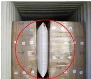
Fig. 6. Co-Strap

Para evitar rupturas en las primeras exportaciones y evitar quiebres de la mercancía se puede añadir las bolas de aire CO-STRAP son diseñadas específicamente para estabilizar y asegurar las cargas dentro de los contenedores.