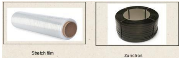
Fig. 5. Embalajes para el yonque

En el caso del embalaje tenemos el stretch film para unitarizar la mercancía. Añadir el zuncho, es una cinta plástica o metálica, de diferentes grosores, utilizada para el amarre o fijación, de forma opcional para mayor seguridad.