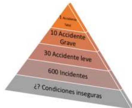
Fig. 2 La Pirámide de Bird también llamada teoría de la pirámide de accidentalidad [33]

Asimismo, la investigación más considerada acerca de los orígenes de los accidentes fue planteado por Frank E. Bird Jr. Este se basa en definir las causas básicas e inmediatas y la deficiente inspección que conducen a un accidente leve, incapacitante e incluso mortal [32].