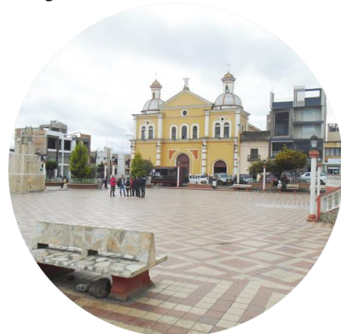
Figura 1 Iglesia San Juan Bautista del municipio de Guachucal – Nariño - Colombia

Es así como el presente proyecto pretende revalorizar y contribuir a la conservación del lenguaje simbólico de la cultura de los Indígenas de los Pastos en la población infantil, en primera instancia se realizarán talleres con los estudiantes de cuarto, quinto y sexto grado, de la Institución Educativa Genaro León del municipio de Guachucal, en Nariño - Colombia, en donde se obtendrán resultados sobre su conocimiento del tema de la simbología de los Pastos, para luego enfocar la investigación hacia una solución tecnológica apoyándose en una metodología de software que permita un trabajo y desarrollo eficaz, enfocados en la gamificación, como técnica de aprendizaje acompañada de juegos, en donde los niños puedan conocer, observar e interactuar sobre la interpretación de la simbología de los Pastos, con el fin de beneficiar el aprendizaje y la valoración cultural de este maravilloso legado.