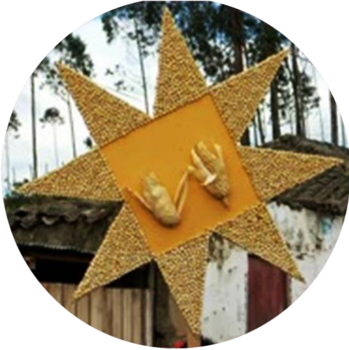
Figura 7 Sol de los Pastos en fiestas populares del municipio de Guachucal

simbología de esta cultura, por lo que se pretende contribuir a la presente comunidad indígena a través de un aplicativo tecnológico que brindara un aprendizaje interesante, interactivo, llamativo y novedoso para la población infantil del municipio de Guachucal en el departamento de Nariño en Colombia.