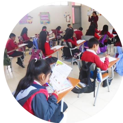
Figura 2 Estudiantes de cuarto grado de la Institución Educativa Genaro León del municipio de Guachucal

El problema radica en que cada vez hay menos personas que hablan y entienden el lenguaje simbólico de los Indígenas Pastos, la falta de documentos escritos o alternativas de difusión sobre este tema hace que no se preserven y la influencia de otras lenguas y culturas. Es necesario tomar medidas para conservar este lenguaje simbólico sobre todo en las nuevas generaciones, ya que representa una parte importante de la cultura e identidad de los Indígenas Pastos. Por lo tanto, la búsqueda y el desarrollo de instrumentos que conlleven a despertar y retomar el interés por el tema en cuestión, son relevantes para toda la sociedad; de continuar con la problemática del desconocimiento y falta de promoción y difusión del lenguaje simbólico de los Indígenas Pastos, se estaría dejando en el olvido la importancia de esta cultura que conlleva diferentes aportes y manifestaciones que constituyen las raíces de estas comunidades que han venido sosteniéndose a través del tiempo.