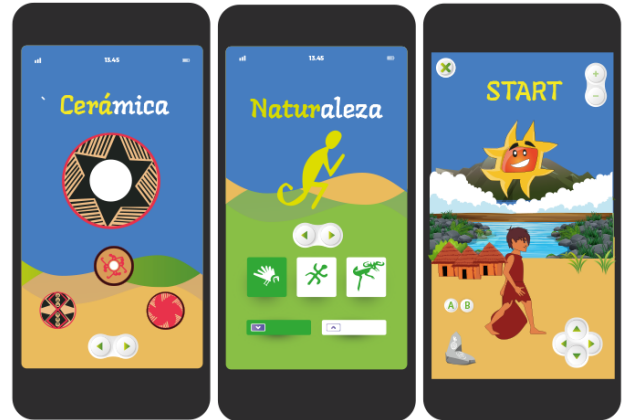
Figura 6 Prototipo de diseño de Interfaz de la app móvil

Por otro lado, se observa las siguientes ventanas del aplicativo resaltan temas como la cerámica y naturaleza de la región, por último, se puede ver un juego de rol, en el que el usuario adopta la figura de un personaje de los Indígenas Pastos recorriendo el territorio, conociendo su simbología y su significado.