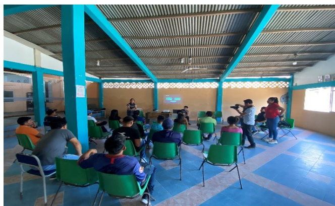
Figura 4. Evidencias de la acogida en el lanzamiento del proyecto.

Aceptación del programa: Al realizar el lanzamiento del programa los comuneros demostraron su satisfacción y curiosidad entre aquellos que se mostraron interesados, ya que, desde el primer momento, se evidenció un gran entusiasmo por parte de la comunidad, quienes se mostraron receptivos a las posibilidades en desarrollar temáticas para sus artesanías y ávidos de adquirir nuevos conocimientos como se puede apreciar en la siguiente Figura 4.