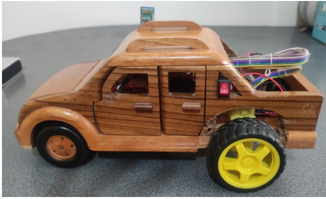
Figura 6. Prototipo de carro Bluetooth integrado en artesanía.