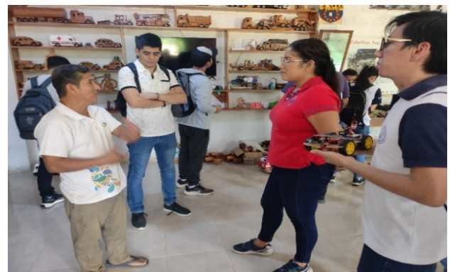
Figura 1. Taller en donde se elaboran vehículos de madera a escala.

Además, una revisión de las artesanías como parte de un recorrido por los talleres de los artesanos para observar de primera mano las artesanías que se producen en la comunidad, valorando su calidad, variedad, identidad cultural y potencial para la innovación como se puede apreciar en la Figura 1.