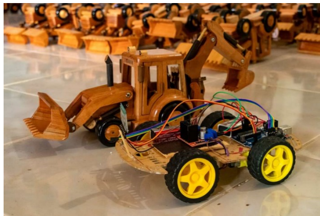
Figura 3. Proyecto elaborado en talleres prácticos.

Para la ejecución de estos talleres se lleva a cabo el diseño de prácticas y manuales de guía adaptadas a distintos niveles de habilidad y conocimiento con el fin de motivar a los participantes. En estos, se presentan prácticas diseñadas previamente que introducen a los participantes en los conceptos fundamentales de Arduino, abarcando desde la identificación de componentes hasta la programación de circuitos. Se ofrecen ejemplos prácticos para ilustrar el uso de los microcontroladores en diversas aplicaciones. Además, se brinda asistencia técnica para abordar problemas y comprender conceptos más complejos que puedan surgir durante la ejecución de las prácticas. Se complementan estas actividades prácticas con lecciones teóricas, evaluando así la comprensión teórica y práctica de los participantes. Este enfoque integral tiene como meta fortalecer la aplicación efectiva de conocimientos sobre microcontroladores en la comunidad, presentando un enfoque estructurado y adaptativo para la enseñanza plasmándose en lo provechoso de cada taller como se muestra en la siguiente Figura 3.