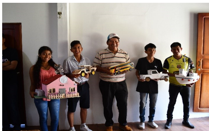
Figura 5. Evidencia de la feria con la presentación de los proyectos.

Fortalecimiento de Capacidades Tecnológicas: El proyecto no solo cumplió con su objetivo educativo, sino que también contribuyó al fortalecimiento de las capacidades tecnológicas de la comunidad como se muestra en la Figura 4, adquiriendo habilidades en microcontroladores y tecnología, los participantes se encuentran mejor preparados para enfrentar un futuro más tecnológico en capacidades de desarrollar integraciones entre lo tradicional y lo tecnológico como en la Figura 5.