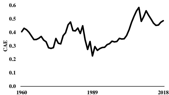
Fig. 2 Evolución de la apertura comercial de Perú, 2022

externa, sin embargo, por debajo apuesta más por su mercado interno [26].