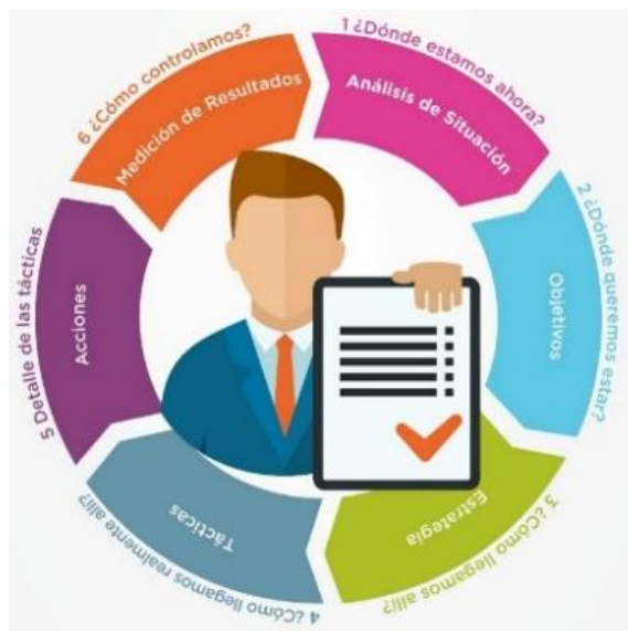
Fig 1. Etapas de la Metodología SOSTAC

situación actual de la empresa a nivel interno es regular, ya que gestiona todos sus recursos adecuadamente pero aún no se adapta a las nuevas tendencias tecnológicas que demanda el mercado actual, de igual manera a nivel externo, se encuentra en la misma situación debido a que su competencia tiene más porcentaje de participación en el mercado, sin embargo, si se aprovechan las oportunidades que brinda el sector se puede potenciar el reconocimiento y preferencia de los clientes.