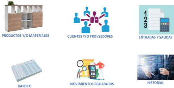
Fig. 3 Planificador de recursos

Finalmente se aplicó la quinta S que significa “Disciplina”; en donde se propuso realizar charlas motivadoras, utilizar advertencias de cumplimiento de los nuevos cambios impuestos, reconocer el desempeño del trabajador y entre otras acciones a tomar para que las nuevas modificaciones puedan convertirse en un hábito. Así también, se anunciará que quien no cumpla con el reglamento interno impuesto en las 4S anteriormente mencionadas, a la tercera llamada de atención se le hará limpiar al trabajador todo el taller, y en caso también desobedezca dicha orden se le descontará un monto de 50 soles (13 dólares) en su sueldo. Así también se implementó un plan de auditoría que se debe realizar trimestralmente para conocer los aspectos a mejorar.