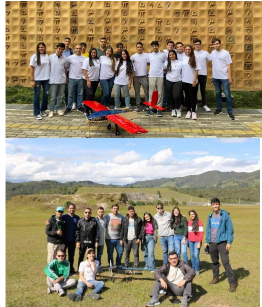
Fig 3. Grupos de estudiantes y docentes participantes en diferentes versiones del DBF.

Realizando el análisis prospectivo de esta práctica se espera que esta se convierta en un futuro en el proyecto capstone del programa de Ingeniería Aeronáutica bajo el modelo de acreditación ABET, para alcanzar este objetivo se deben alinear o establecer sus equivalentes en lo referente a los resultados de aprendizaje establecidos por ABET y las capacidades y competencias declarados por el programa.