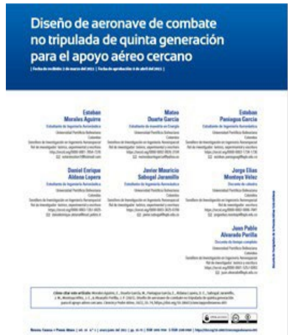
Fig 4. Publicación artículo en revista indexada. [14]