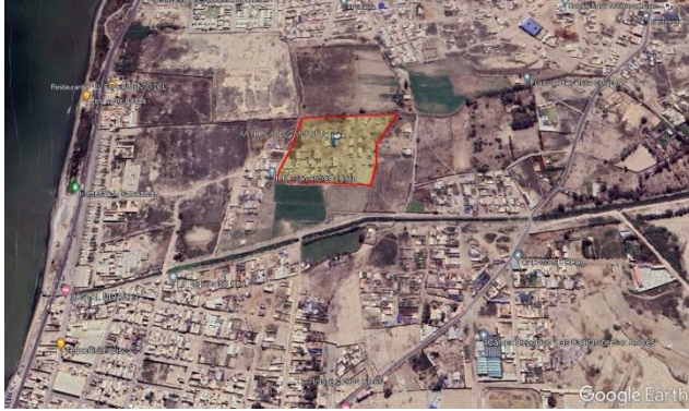
Fig. 1: Ubicación en el Google Earth.

Para una vivienda de 7.00 x 20.00 m., para dos familias que alberga la vivienda, se distribuye tal como se muestra en la Fig. 2. Asimismo, señalar que en este tipo de vivienda tiene un total de 84 m 2 construido con madera y techo cubierto entre calamina y planchas de triplay.