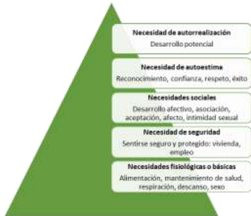
Figura 1: Pirámide de las necesidades de Maslow

Para Maslow [5], las necesidades inician desde la parte inferior de la pirámide en donde se ubican las conocidas necesidades primarias o también consideradas como materiales dado que aparecen desde el nacimiento del individuo y son indispensables para su crecimiento. Por otro lado, están las necesidades secundarias o también conocidas como espirituales, que se van adquiriendo en proporción al desarrollo personal de la persona. De manera que cada categoría ejerce una influencia dominante sobre el comportamiento del individuo en el momento en que las necesidades inferiores están cubiertas totalmente.