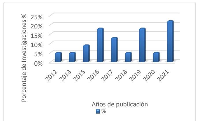
Fig. 2 Investigaciones incluidas según su año de publicación

Asimismo, de las 22 investigaciones incluidas en esta revisión sistemática, en la Fig. 2 se muestra que hay un mayor porcentaje de investigaciones en los años 2021 con un 22%, siguiendo los años 2016 y 2019 con un 18%, en el año 2017 un 14%, año 2015 un 9% y por último en los años 2012; 2013; 2018 y 2020 tuvieron una inclusión del 5% del total. El año que tuvo el mayor porcentaje de investigaciones fue el año 2021.