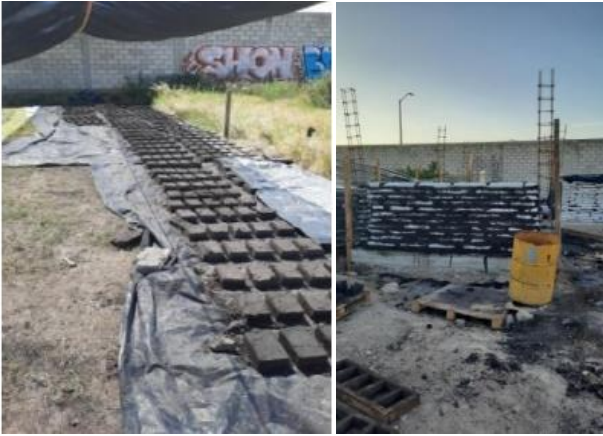
Fig. 3 Preparación de adobes, foto izquierda y Superadobes en bolsas, foto derecha.

Las ventanas fueron hechas con madera y con doble vidrio hermético, acorde a la idea de hacer la aislación térmica y acústica, y los revoques se realizaron en una proporción 1/3 arena, 1/3 arcilla y 1/3 cal apagada, con agua con nopal estacionada durante 7 días como mínimo. Ver Fig.4.