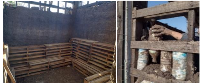
Fig. 1 Estructura de pallets con botellas y pallets para piso

0,5mm. con aislación de poliestireno de 10 cm. de espesor, lámina antihumedad, membrana aislante de polietileno de 5 mm. y láminas de madera de 12 mm. por debajo. Con respecto al piso: El piso interior será un piso flotante realizado con pallets que proporcionan una capa de aire de 9 cm. y espesor de base y tránsito de 1,5 cm., el cual está ubicado por sobre el piso de hormigón. Con respecto a las aberturas: Las ventanas utilizadas son de madera con celosías de cerramiento y ventanas con doble vidriado hermético (VDH) con cámaras de aire del tipo 3 x 12 x 3mm. [8]. Ver Fig. 2.