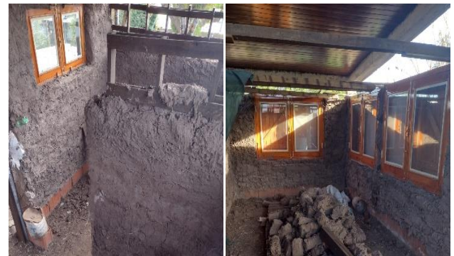
Fig. 2 Pared interna modelado directo, foto izquierda; Adobes y ventanas, foto derecha.