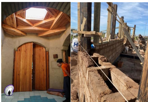
Fig. 7 Espacio central. Distribuidor de la vivienda con el techo Hogan, foto izquierda y Pared de Adobe con “traba hueca” foto derecha.

En la Fig. 8 se observa la construcción terminada.