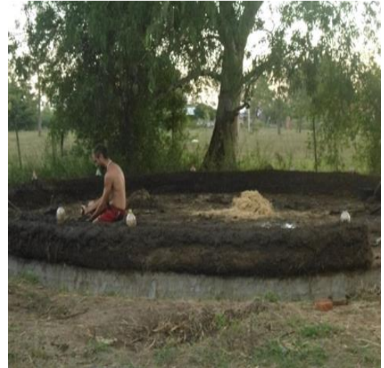
Fig. 5 Levantamiento de paredes con modelado directo y ecoladrillos intercalados.

Se buscó reforzar la idea de base circular, de 9 m de diámetro, con paredes de 45 cm de espesor al norte y 50 cm de espesor al sur, con muchas ventanas de doble vidrio hermético, desde el este, norte y oeste, y una pequeña ventana al sur, para generar ventilación cruzada. Ver Fig. 5 y 6.