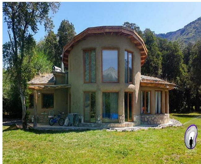
Fig.8 La casa en el Hoyo, Chubut, Argentina