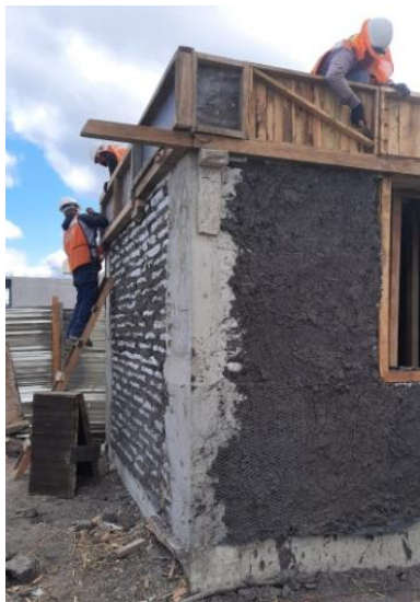
Fig. 4 Vista de pared con superadobes en bolsas, columna de cemento, y pared con revoque grueso.