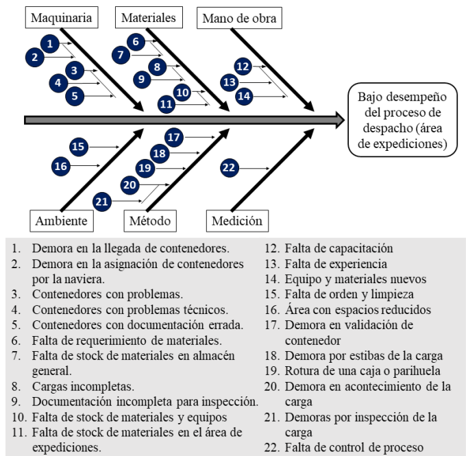
Fig. 1 Causas que afectan la productividad total actual del proceso.

En la Tabla II, se aprecian el resumen de los datos del Check List actual de las 5 S (PRE-TEST) del área de expediciones, como se puede apreciar el área tiene una calificación de 110 de un total de 250, siendo el 44 % del total.