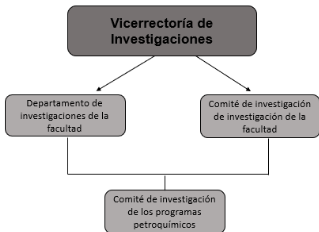
Fig. 2 Organigrama para la gestión de PG

Considerando la estructura organizacional de la Universidad de Cartagena se adapta el organigrama vertical del sistema como se muestra en la Figura 2. Dentro de la cual ingresará a hacer parte en el último nivel de jerarquía el comité de investigaciones de los Programas Petroquímicos.