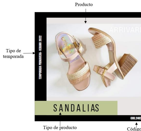
Fig.4 Estructura de publicación propuesta

Después de la estructura, se diseñó una pauta para el período enero 2022/ enero 2023 con la propuesta de publicidad pagada a seguir. Esta se basó en los registros de publicidad del período analizado, el porcentaje que obtuvieron los diferentes tipos de calzado tanto en los ingresos como en la cantidad de pares vendidos, la demanda histórica de los productos y los resultados obtenidos de la publicidad utilizada.