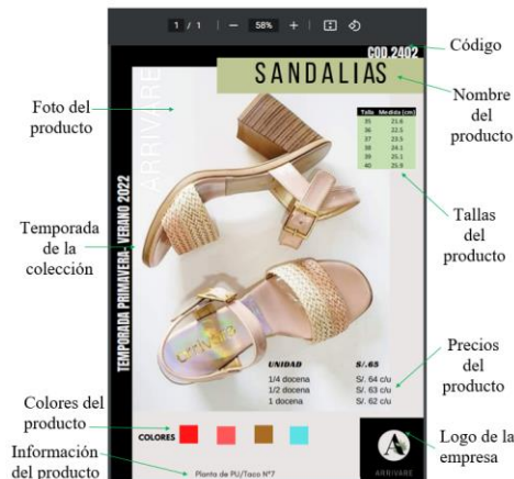
Fig.7 Propuesta de diseño de página para calzado

Se propuso diseñar un catálogo online, a través de la herramienta de Social Media Marketing, en donde se registren todos los productos que produce la MYPE y este a disposición instantánea tanto del cliente como de las vendedoras.