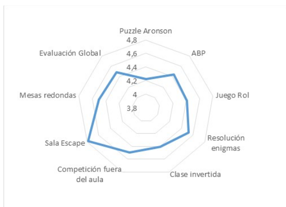
Fig. 4. Resultados de la evaluación de la experiencia

Por lo tanto, y debido a los resultados de la evaluación, se puede concluir que se han desarrollado plenamente los objetivos propuestos inicialmente, construyendo un conjunto