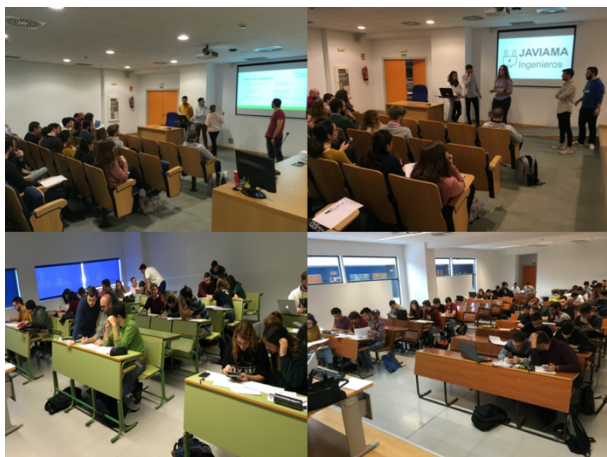
Fig. 1. Estudiantes de ingeniería trabajando con metodologías activas

Por último, se debe indicar que el número de alumnos implicados en el desarrollo de este proyecto durante los dos 2 años de ejecución del mismo ha rondado los 300 en la Universidad de Málaga y 148 en la Universidad Politécnica de Valencia. En la Fig. 1 puede observarse diversas actividades llevadas a cabo con alumnos de varias asignaturas durante la realización de esta investigación.