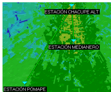
Figura 2.- Cobertura de las estaciones de la Red Troncal, desde las Antenas Directivas desde la Estación Chacupe Alto; simulación realizada en el software Radio Mobile

A continuación, en las siguientes figuras, se muestra el nivel de éxito del enlace troncal punto multipunto entre estaciones. Haciendo uso de las especificaciones técnicas según el tipo de antena directiva a utilizar, y guiándonos de la escala de colores.