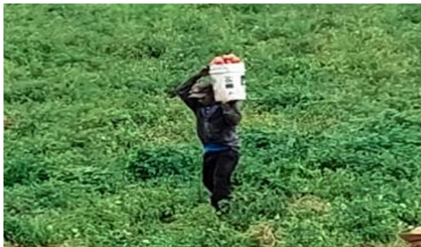
Fig. 1. La explotación detrás de las frutas y verduras.

El problema identificado involucra el peso de cada cesta de frutas o verduras (promedio de 40 libras). Este peso causa fatiga física y lesiones que se pueden producir de forma inmediata, acumulación de pequeños traumatismos, aparentemente sin importancia, hasta producir lesiones crónicas [13]. El desgaste físico afecta directamente al trabajador primero físicamente y luego económicamente (compra de medicamentos, citas con doctores, etc.) Igualmente, el empleador se ve afectado por ineficiencia o cansancio del empleado por motivos ya mencionadas en este escrito.