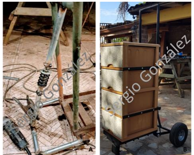
Fig. 4. A. Finalización de la colocación del amortiguador en el dispositivo. B. Prototipo finalizado.

Se utilizó una carretilla antigua como base estructural del nuevo dispositivo. Al armar el esqueleto, se confeccionó la suspensión del dispositivo. Primero, soldando los pernos en la estructura donde va a pivotar el eje de las llantas. Se armaron los bujes con dos tubos y se montaron balineras de cada lado. Luego, los dos tubos que están conectados con el eje pivoteador, se soldaron al tubo de \frac{3}{4} de pulgada. En la mitad del eje de las ruedas se soldó un tubo de \frac{3}{4} pulgadas el cual se le colocó un amortiguador que a su vez también se soldó con la estructura de la carretilla. Se fabricaron las barandas de seguridad, se le hizo tres agujeros a cada baranda con una broca \frac{3}{16} ". Se pintó la estructura de la carretilla y se fijó el gavetero a la carretilla con remaches.