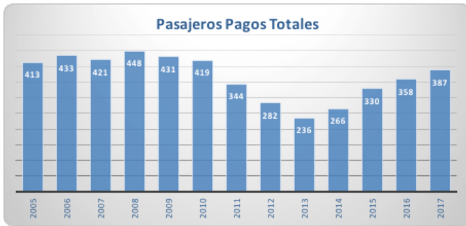
Fig. 2 Cantidad de pasajeros pagos totales en función del tiempo Fuente: C.N.R.T. [11]