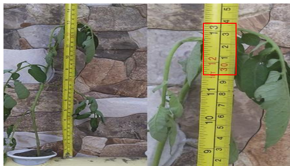
Fig. 3 Medición del escenario 1, con flexómetro.