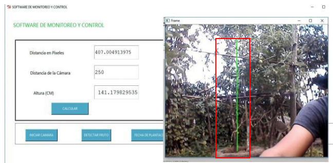
Figura 4. Medición del escenario 2, con software propuesto

Se utilizó una planta de tomate ubicada en una huerta casera, donde se determinó una altura 141 cm, medida que fue corroborada con un flexómetro. Luego se realizó la medición con el software, encontrando una medida estimada de 141.17 cm. Donde se obtuvo una buena medición. Para este experimento se ubicó la cámara a una distancia 250 cm en línea horizontal respecto a la planta de Tomate. En la figura 4 y 5, se puede evidenciar los resultados mencionados anteriormente.