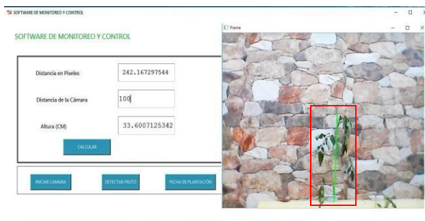
Fig. 2 Medición del escenario 1, con software propuesto.

Este experimento se realizó en un invernadero hidropónico a escala, donde inicialmente se midió con un flexómetro una planta de tomate, encontrando una altura de 33.6 cm. Para la estimación de la altura con el software, se debe hacer un trazado con el mouse de la altura que se pretende medir, luego de este procedimiento se encontró una medida estimada de 33.7 cm. Presentando un margen de error relativamente bajo, en comparación con la medición del flexómetro. Los resultados descritos anteriormente, se pueden evidenciar en la figura 2 y 3.