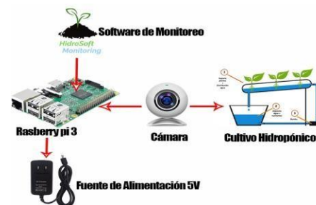
Fig 1. Diagrama de bloque del sistema propuesto.

Para el desarrollo de la herramienta, a nivel de hardware se utilizó una tarjeta Raspberry pi 3B, una cámara genérica de 5 Megapíxeles con resolución de 680x640, un portátil 5 núcleos con una memoria RAM de 8GB, a nivel de software; se trabajó con el lenguaje de programación Python y la librería Opencv. Para el funcionamiento del software se debe garantizar unas condiciones mínimas, donde se destaca una posición fija de la cámara, una distancia de la cámara estimada que permita observar bien el crecimiento y un lugar donde no esté expuesta a condiciones climáticas muy fuertes, que pueda alterar las mediciones. En la figura 1, se evidencia el diagrama de bloque del sistema.