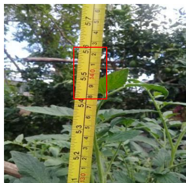
Figura 5. Medición del escenario 2, con el flexómetro