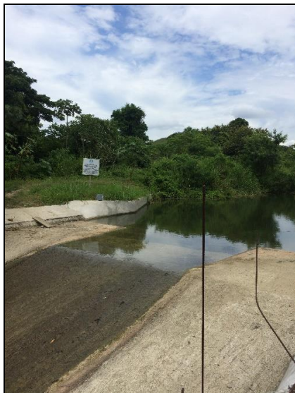
Fig. 4 Tape técnico-artesanal, de hormigón armado, último realizado en la comunidad de Manglaralto, Ecuador.