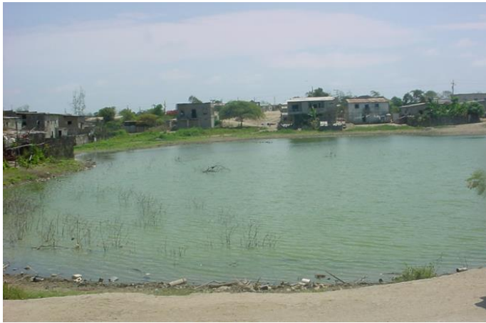
Fig. 2 Albarrada ubicada en la comunidad de Zapotal, Ecuador