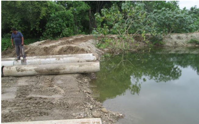
Fig. 3 Tape artesanal de tierra en Manglaralto, Ecuador.