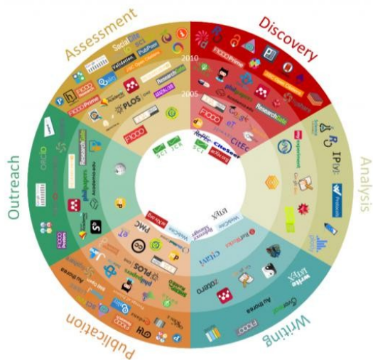
Figura 1. Herramientas y sitios web del proceso científico según Bosman y Kramer [6]

Definido el concepto de Ingeniería, se conoce que existen cinco ramas principales de la Ingeniería llamadas tradicionales [7]: civil, mecánica, eléctrica, química e industrial. Las otras ramas crecen a partir de las principales o algunas que se volvieron más especializadas. Por lo tanto, el Ingeniero en general sin importar su rama o especialidad, así como cualquier otra profesión que genere conocimiento, debe seguir las etapas de un proceso científico y por ende, la comunicación podrá seguir los principios éticos que rigen el Acceso Abierto y que se exponen en este artículo.