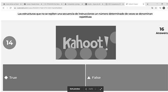
Fig.1 Pregunta en Kahoot

A su vez el alumno en su celular puede visualizar las opciones de acuerdo a la siguiente imagen (figura 2):