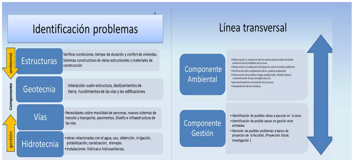
Gráfica 2: Consultorio I-II Identificación de problemas

La etapa inicial de los Consultorios, se puede representar en el gráfico 2. En este se indica, por áreas las posibles alternativas de planteamiento de problemáticas en las cuatro áreas de estudio y las dos componentes como líneas transversales del programa.