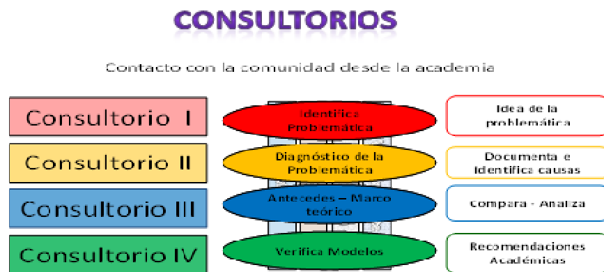
Gráfica 1: Consultorios en acción y resultados esperados

En relación con la organización de los Consultorios en el Pensum, se puede representar en el gráfico 1 siguiente. En este se indica, por niveles en complejidad y de avance diacrónico dentro del Plan de Estudios, cada uno de los cuatro Consultorios establecidos, indicando horizontalmente para cada uno su relación con los objetivos planteados y los resultados esperados (columna derecha), y como éste está articulado con cada uno de los niveles de formación en investigación establecidos en el Pensum como parte del Área de Formación en Investigación.