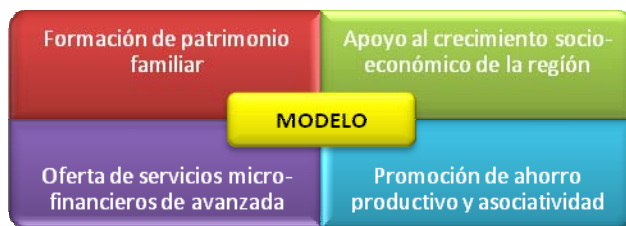
Figura 1: Características distintivas de Finampyme y su confluencia.

Como punto de partida se determinaron las características distintivas de Finampyme que fueran transferibles al tema de EI y se estableció la zona de confluencia como origen del modelo, lo cual se ilustra en la Figura 1.