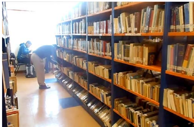
Figura 1: Guardar libros

A continuación, se describirán las actividades representativas del puesto de Auxiliar de Biblioteca, identificando los factores de riesgo ergonómicos presentes en cada una de las actividades realizadas. Estas actividades deben ser detalladas e incluir fotografías como en la figura 1