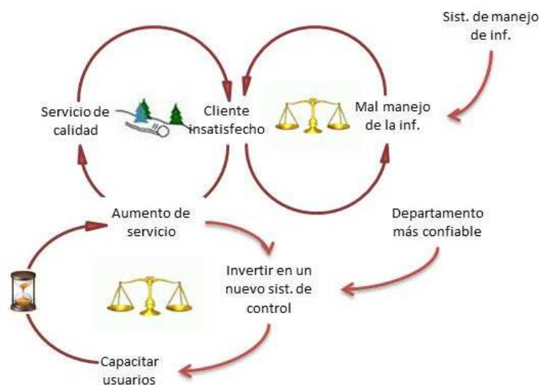
Figura 1: Problemática de Solamava, C.A. según Arquetipos Sistémicos

Esta fase buscó estudiar a fondo el sistema visto de forma holística y posteriormente profundizar en cada uno de los aspectos resaltantes. Siguiendo ese orden, se procede a estudiar a Solamava, C.A. como un todo generando una visión amplia del sistema, para luego ahondar en el Departamento de Almacén y Cobranza, objeto fundamental de estudio, dilucidando cada una de las anomalías aquí presentes; quienes bajo estudios rigurosos basados en el enfoque de sistemas como lo son: análisis de focos problemáticos, análisis causa - efecto, análisis motricidad - dependencia, lograron captar la principal anomalía que acarrea al departamento en cuestión, la cual es el mal manejo de la información existente en todos los niveles de la descritas por (Senge, 1994) que responde a los arquetipos sistémicos ya que son una adaptación del pensamiento de sistemas. A continuación se muestra la figura 1 que describe la situación del mal manejo de información bajo esta perspectiva. Un proceso clave dentro del departamento es la gestión y realización de servicios, que gracias al buen desempeño en obra los clientes se sienten satisfechos, incrementando así la generación de nuevos servicios lo que dificulta la gestión interna de la empresa para con los nuevos y cada vez en incremento servicios generados. El proceso antes descrito se adapta a dos arquetipos fundamentales, el primero límite del crecimiento y segundo el crecimiento y subinversión.