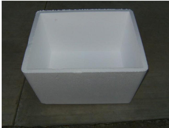
Figura 1: Caja de Poliestireno

Las siguientes figuras representan la memoria fotográfica correspondiente a la fabricación de la estufa termo en los laboratorios del Centro Universitario de la Costa Sur.