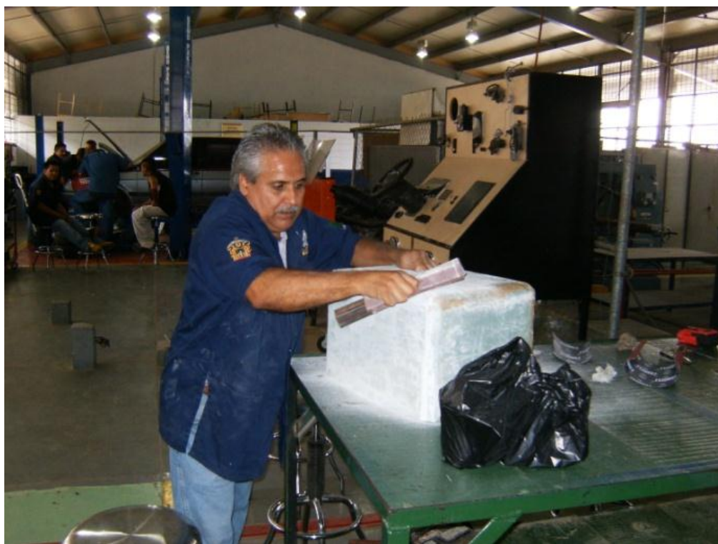
Figura 5: Pulido de la Resina de Polyester ya Solidificada