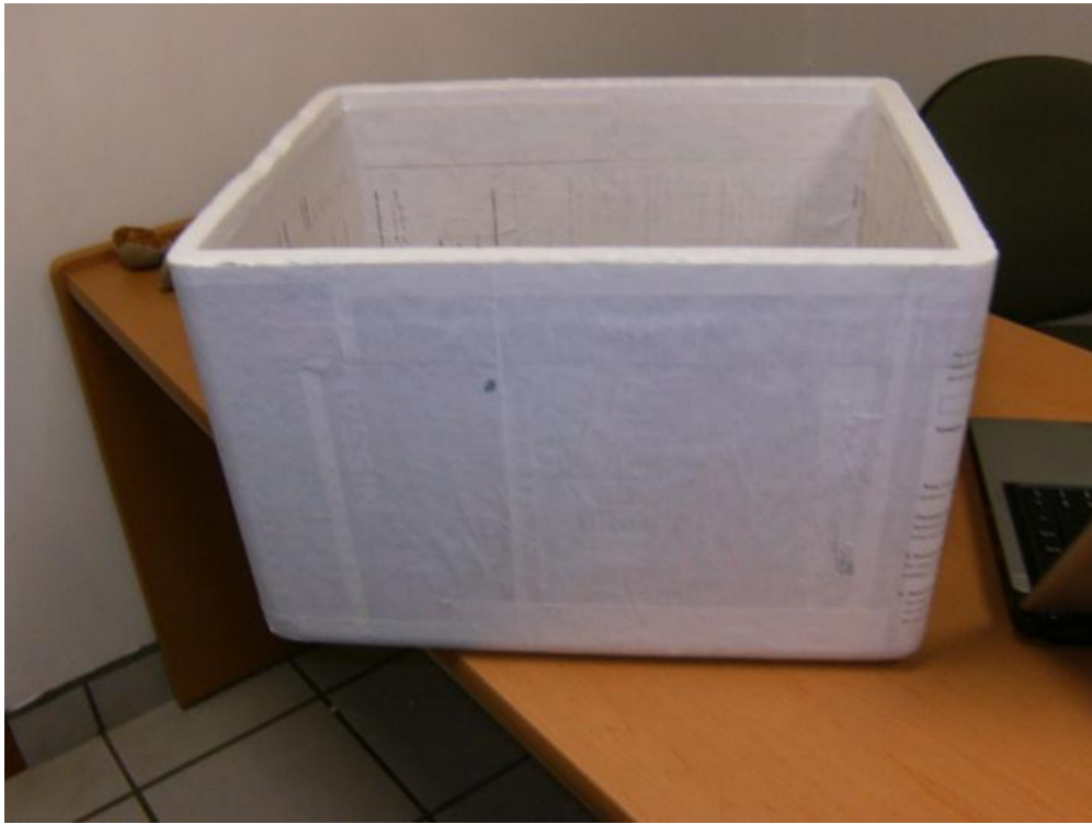
Figura 3: Caja de Poliestireno con Fondo de Papel Reciclado