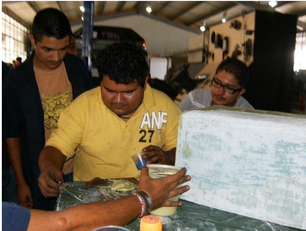
Figura 4: Aplicación de Resina de Polyester