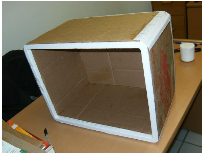
Figura 2: Caja de Poliestireno Recubierta con Cartón