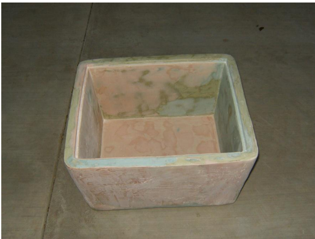
Figura 6: Pulido para el Proceso de Pintura