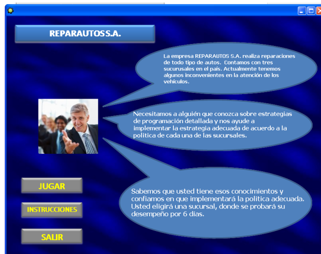
Figura 4: Pantalla inicio juego

A continuación se presentan imágenes del videojuego, el cual fue desarrollado con la herramienta Gamemaker 8.0 en su versión gratuita. Gamemaker en una plataforma para el desarrollo de videojuegos.