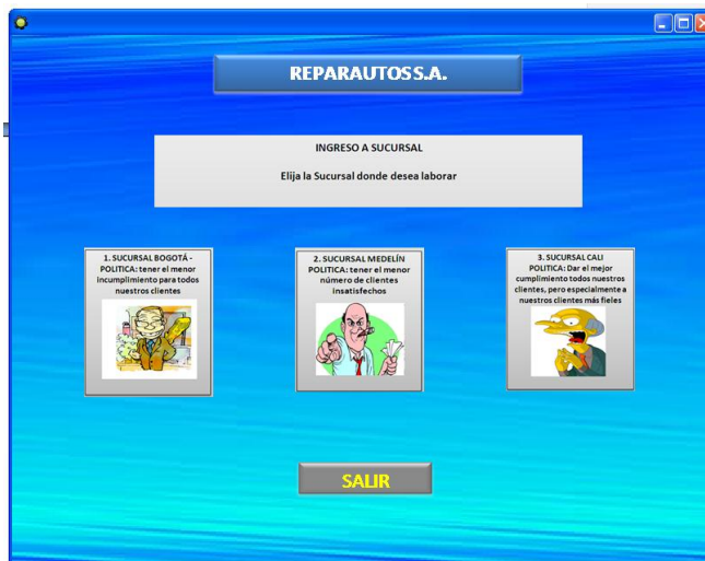
Figura 5: Pantalla