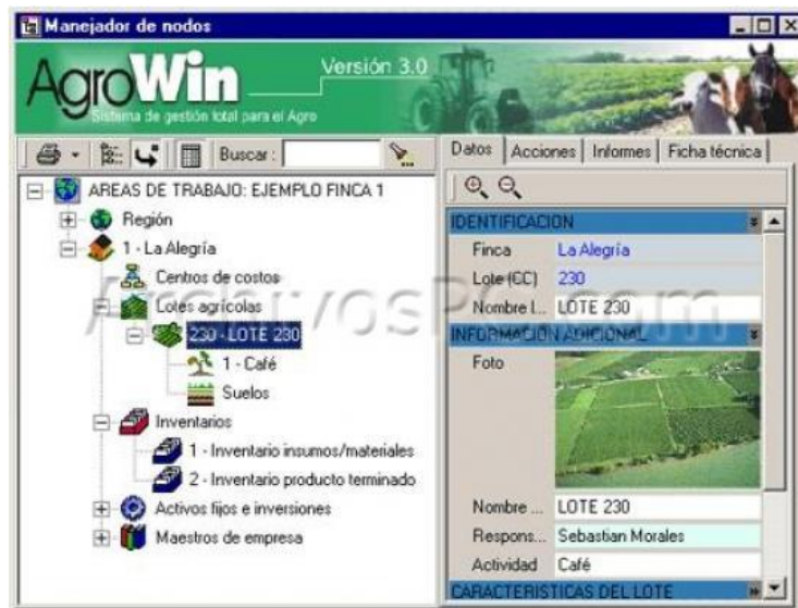
Figura 3: Interfaz de usuario AGROWIN

AgroWin es un sistema integrado para administración de fincas que le permite al agricultor optimizar la evaluación, el control y la toma de decisiones a nivel de las diferentes actividades productivas, mediante una herramienta técnica, financiera y administrativa. Sin lugar a dudas es una herramienta muy buena, pero tiene sus dificultades en los puntos que mencionaremos a continuación: