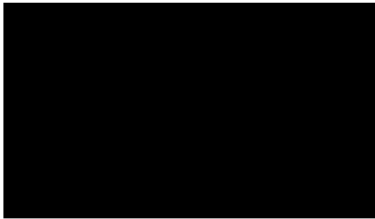
Figura 11: Comparación Resistencia Vs Días en función del área bruta