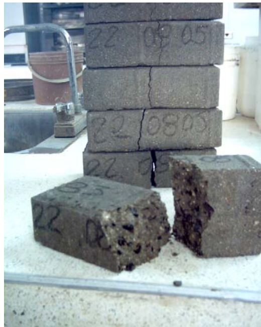
Figura 8: Adoquines ya ensayados a la flexión

Los resultados cumplen satisfactoriamente las exigencias de la norma NTC ICONTEC, según estas normas, la resistencia promedio mínima para adoquines de este tipo debe ser de Según la norma Icontec 2017 “adoquín de hormigón” la resistencia individual de cada adoquín no debe ser inferior a 3.5Mpa y en promedio no debe ser menor de 4.5Mpa, los resultados obtenidos en la investigación arrojaron que la resistencia promedio obtenida para los adoquines testigo a los 28 días fue de 9.1 Mpa, para los adoquines con el 10% de cuesco fue de 6.71Mpa. los valores reflejan la utilización de agregados secos, densos y lavados y con un buen grado de compactación, gracias a estas cualidades se produce un mortero mas denso y a su vez mucho mas resistente y en mayor medida la resistencia obtenida con adoquines peatonales a los 28 días satisface las exigencias establecidas por la norma