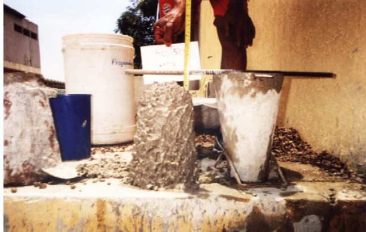
Figure 1: Ensayo de determinación de asentamiento de la mezcla con cuesco

Por este motivo se estableció un análisis comparativo entre dos mezclas de concreto, una muestra patrón hecha con agregados tradicionales empleados en la ciudad de Barranquilla como lo es la grava triturada de arroyo de piedra y la arena santo Tomás y la muestra en estudio hecha con cuesco combinado con los materiales citados. Este análisis se hizo con el fin de establecer hasta que punto se ve afectada la resistencia a la compresión a los 28 días del concreto elaborado con el cuesco con respecto a la resistencia establecida en el diseño