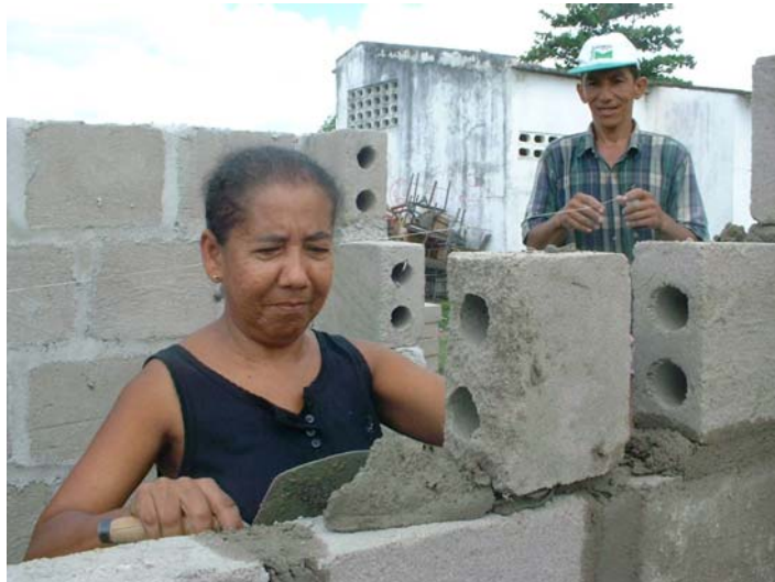
Figura 12: Autoconstrucción de viviendas de interés social

Aspiramos a implementar una nueva fase de esta investigación, trabajando con modelos a escala real de viviendas, donde los bloques que se usen para la construcción de las mismas, sean bloques fabricados con cuesco de palma africana