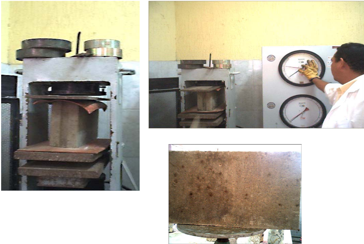
Figura 9: Ensayo de bloques de mortero y cuesco

Por lo tanto, como la resistencia a la compresión es uno de los parámetros más importantes en lo referente a los factores que rigen el uso de bloques de mampostería; esta resistencia debe cumplir con valores determinados por las normas como son resistencias a la compresión entre 1,5 y 2 MPa para ser catalogado como bloques no estructurales.