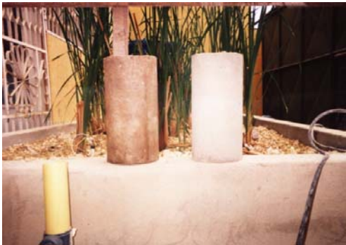
Figure 2: Cilindros de concreto estandarizados

Para tal comprobación se realizaron ensayos de laboratorio los cuales consistieron en la elaboración de 120 probetas cilíndricas de 15 cm de diámetro por 30 cm de altura, es decir 30 probetas para cada edad del concreto (7,14,21 y 28 días), estos mismos ensayos se realizaron con mezclas usando el cuesco de semilla de palma africana, como material constitutivo de la mezcla, obteniendo así un total de 240 probetas para la combinación más eficiente de agregados y dejando para días posteriores algunas muestras que corresponden ya a una segunda fase de la investigación. De esta manera se podría mirar el porcentaje de degradación en que se ve afectado el concreto endurecido por la presencia de este material en el tiempo.