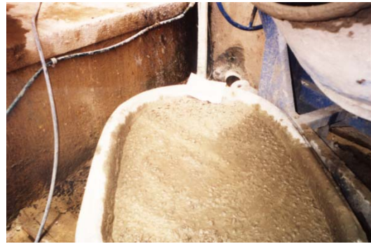
Figura 3: Mezcla de concreto que incluye el cuesco

El cuesco en general ha sido tratado como un agregado normal para lo cual se le hicieron los mismos ensayos que el agregado triturado, ensayos de laboratorio que describen las normas NTC de los agregados para concreto.