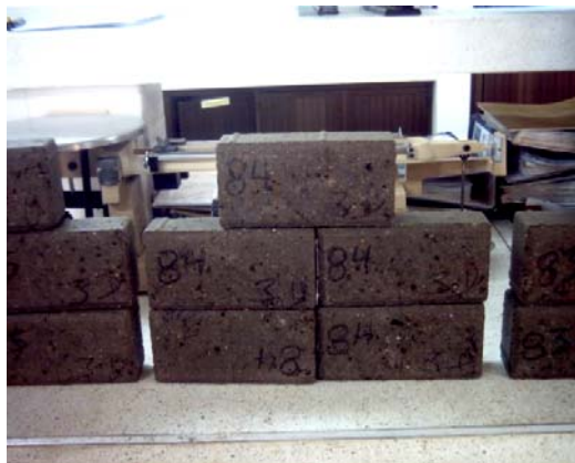
Figura 6: Adoquines de mortero y cuesco