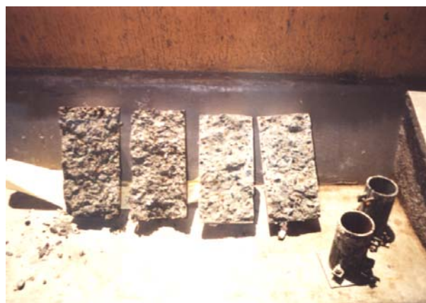
Figura 5: Cilindros de concreto, ensayados a la compresión. El cilindro de la izquierda, es el fabricado con Cuesco