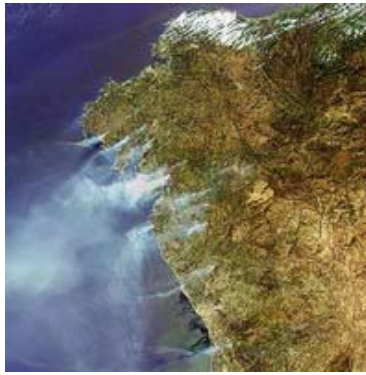
Figura 2. Satélite Envisat – Imagen 2

La figura 2 captada por el satélite Envisat, corresponde con los incendios de Galicia y Portugal en 2006.