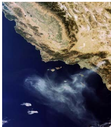
Figura 1. Satélite Envisat – Imagen 1

Los sistemas de detección de incendios forestales a través de imágenes recogidas por los satélites son los más novedosos. Tanto la NASA como la agencia espacial europea están usando esta tecnología en sus proyectos de detección.