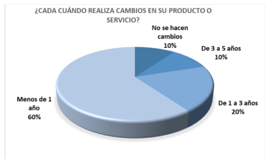
Fig.2. Gráfica que muestra la proporción de las MiPyME sobre el tiempo en que realizan cambios a su producto o servicio. Fuente: propia.

A la pregunta 3, cada cuándo realiza cambios en su producto o servicio, el 60% manifiesta que menos de un año, el 20% lo hace de uno a 3 años, el 10% de 3 a 5 años, y el 10% no hace cambios [ver figura 2].