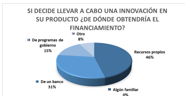
Fig.5. Gráfica que muestra la proporción de las MiPyME sobre la fuente de financiamiento para llevar a cabo los cambios a sus procesos o productos.

Para la pregunta 9, si decide llevar a cabo una innovación en su producto ¿de dónde obtendría el financiamiento?, el 46% lo realizaría con recursos propios, el 31% buscaría recursos