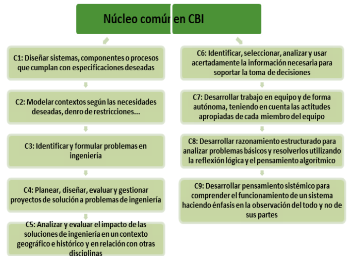
Fig. 2 Núcleo común en ciencias básicas de ingeniería.

A nivel externo, se tomaron como referencia los siguientes estándares internacionales de competencias para la formación de estudiantes de ingeniería: ABET [19], CDIO [24], NAE 2020 [6], TUNING-AL [16].