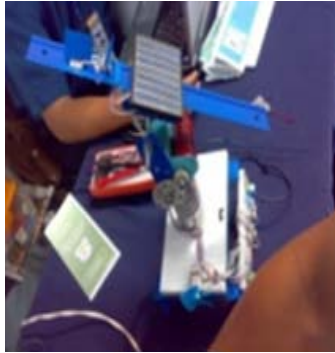
Figura 1. “Sistema de riego alimentado por un seguidor solar”

Cumpliendo con los siguientes criterios de evaluación. Primer parcial: problema, estado del arte del proyecto tecnológico, objetivos, justificación, Introducción, lista de material empleado, diagramas eléctricos, diagramas a bloques y control, cronograma de actividades. Segundo parcial: desarrollo experimental, tablas gráficas, cálculos, diagrama, avance del sistema o prototipo. Tercer parcial: prototipo terminado, informe técnico concluido con toda la metodología, así como exponer el proyecto en la semana de presentación de Proyectos Tecnológico de la División de Ing. Electrónica del TESE organizada por esta División desde el 2006, ver Figura 2.