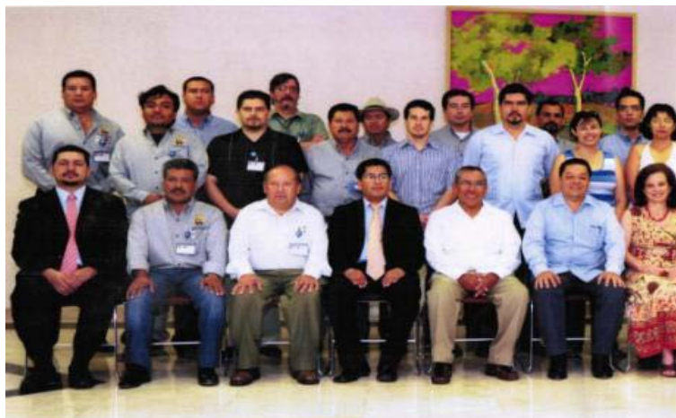
Figura 3. 7ª Reunión nacional de la Red Geomática (Chiapas).