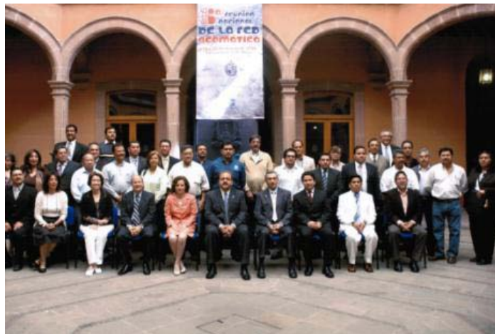
Figura 2. 6ª Reunión nacional de la Red Geomática (San Luis Potosí).