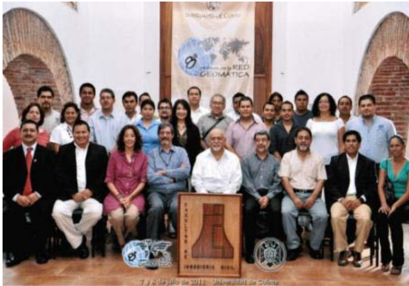
Figura 4. 8ª Reunión nacional de la Red Geomática (Colima).

En otras actividades, alumnos del programa educativo de Ingeniero Topógrafo Geomático de la Universidad de Colima han realizado estancias cortas y visitas a la UASLP. En las estancias, los alumnos se han incorporado a algunas actividades del programa de la UASLP y en la visita de prácticas, alumnos de ambos programas expusieron algunos trabajos que han desarrollado en diferentes asignaturas de sus respectivos programas. Otro resultado de esta Red es el relacionado con las reuniones que se han efectuado entre profesores de la Universidad de Colima y la UASLP con el propósito de analizar e intercambiar puntos de vista sobre ambos programas educativos.